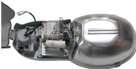
Fig. 1 Módulo óptico y equipo de alimentación originales luminaria VILAMARXANT