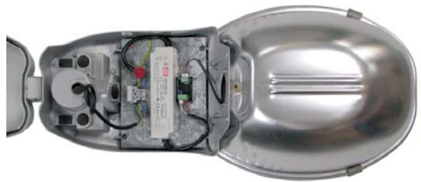
Fig. 6 Montaje del módulo de alimentación ILUZ211.Y y conexión de cables