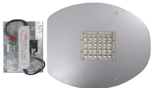
Fig. 2 Acople LED INELCOM ILUZ3A0.A