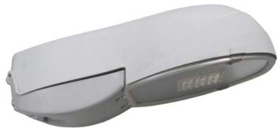
Fig. 8 Luminaria VILAMARXANT con Acople Inelcom ILUZ3A0.A