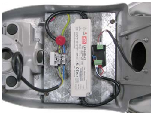
Fig. 5 Montaje del módulo de alimentación ILUZ211.Y y conexión de cables