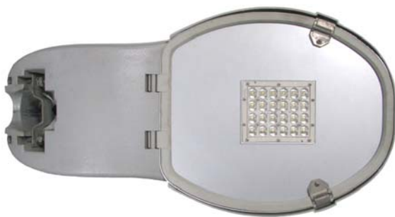
Fig. 7 Luminaria VILAMARXANT con Acople Inelcom ILUZ3A0.A