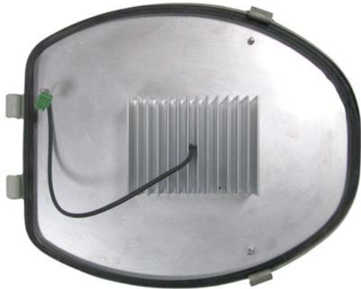
Fig. 3 Montaje del módulo óptico ILUZ210.Y al marco