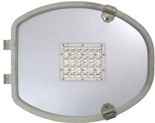
Fig. 4 Montaje del módulo óptico ILUZ210.Y al marco